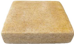
Raclette Gourmet Curry carré