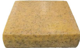
Raclette Gourmet Zitronenthymian carré