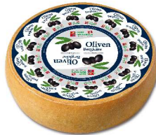
Entlebucher Oliven Bergkäse