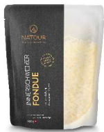
NATOUR Innerschweizer Trockenmischung